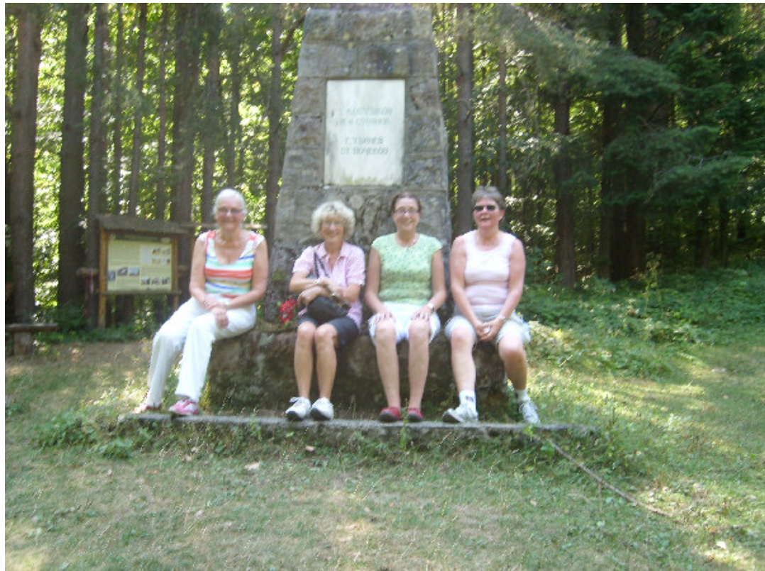
Flitiga vandrare i Nationalparken