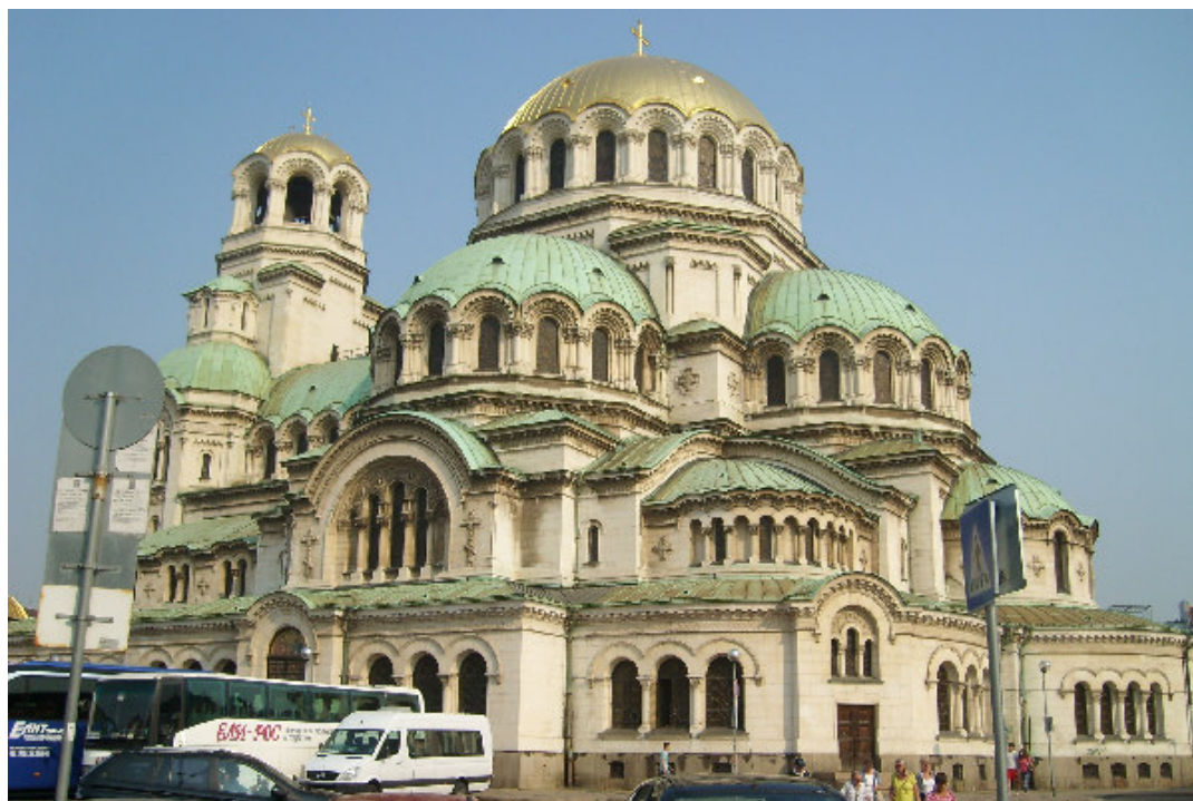
Alexander Nevskij katedralen i Sofia

Då klockan inte var allt för mycket var vi några som tog en promenad i parken runt Kulturhuset. Här var musik i varje hörn. Det var en internationell musikhelg. Nästa förmiddag gjorde vi en promenad genom de centrala delarna och besökte bl.a Alexander Nevskij katedralen, Ryska kyrkan, utgrävningarna från tiden före Kristus med S:t Georges kyrkan som är Sofias äldsta byggnad. Vidare såg vi parlamentet och Nationalteatern alla utsmyckade byggnader.