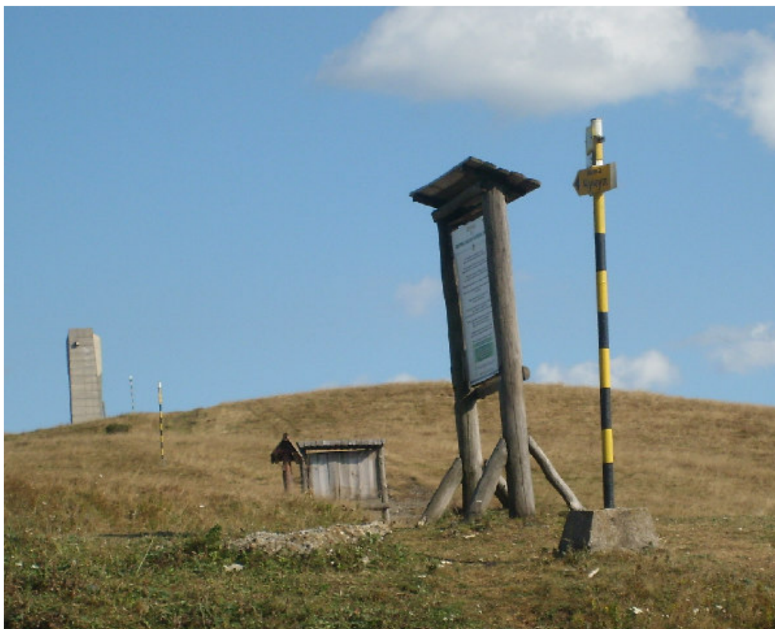
Högsta punkten 1600 m i passet vi passerade

Här intog vi vårt medhavda lunchpaket innan vi fortsatte över Gamla bergen, där högsta punkten i passet ligger på drygt 1600 meter, ner till den lilla byn Cheflika. Här får vi stanna i fem nätter.