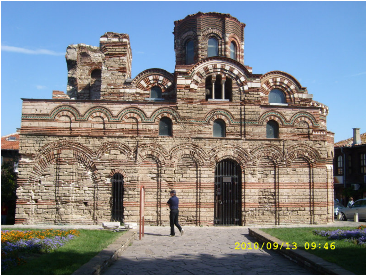
En av alla kyrkor i Nessebur