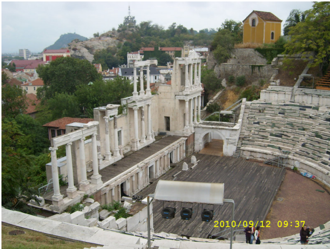
Romerska amfiteatern i Plovdiv

Nästa dag for vi österut till staden Plovdiv, den tredje största. Den är mest känd för sina stora mässor med firmor från hela världen. En gammal stad med kullerstenar på gatorna. Vi besökte Balabanovska huset som är något i stil med Hallwylska palatset och den romerska amfiteatern.