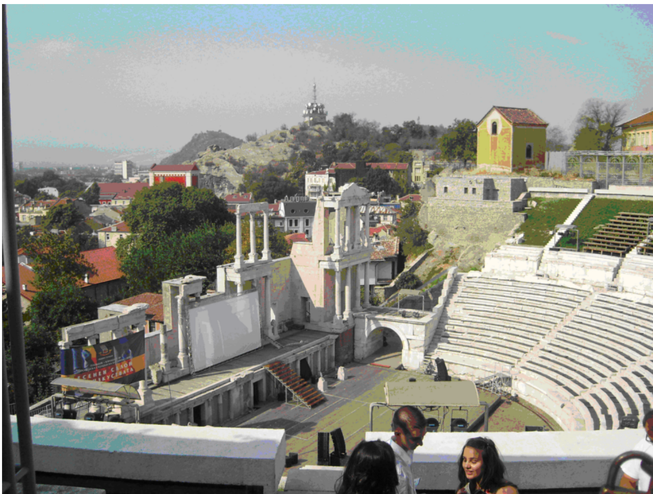
Romerska teatern i Plovdiv

Ännu en resa genom Bulgarien är genomförd. I år var vi totalt 23 deltagare. Efter flyg till Sofia väntade bussen som skulle ta oss runt landet under 10 dagar. Vi hade lite otur då vårt bagage kom på villovägar och hamnade i München i stället för i Sofia. Det kom till oss på tredje dagen.