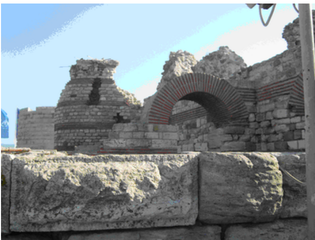
Försvarsmuren i Nessebar