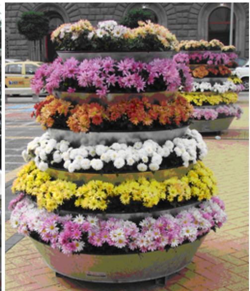
Det nya centrala Sofia

Efter dessa avkopplande dagar åkte vi till Sofia. Där besökte vi de främsta sevärdheterna som Alexander Nevskij katedralen, Nationalteatern, S:t George kyrka som tros vara den äldsta byggnaden i staden. Sista dagen var vi vid Presidentpalatset och i Saluhallen.