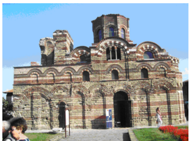
Den fd största kyrkan i Nessebar