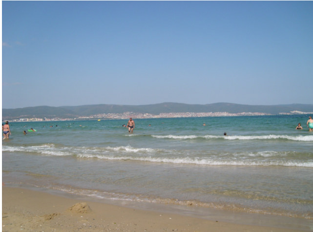
Bad i Svarta Havet

På eftermiddagen var det dags att pröva ett dopp i havet.