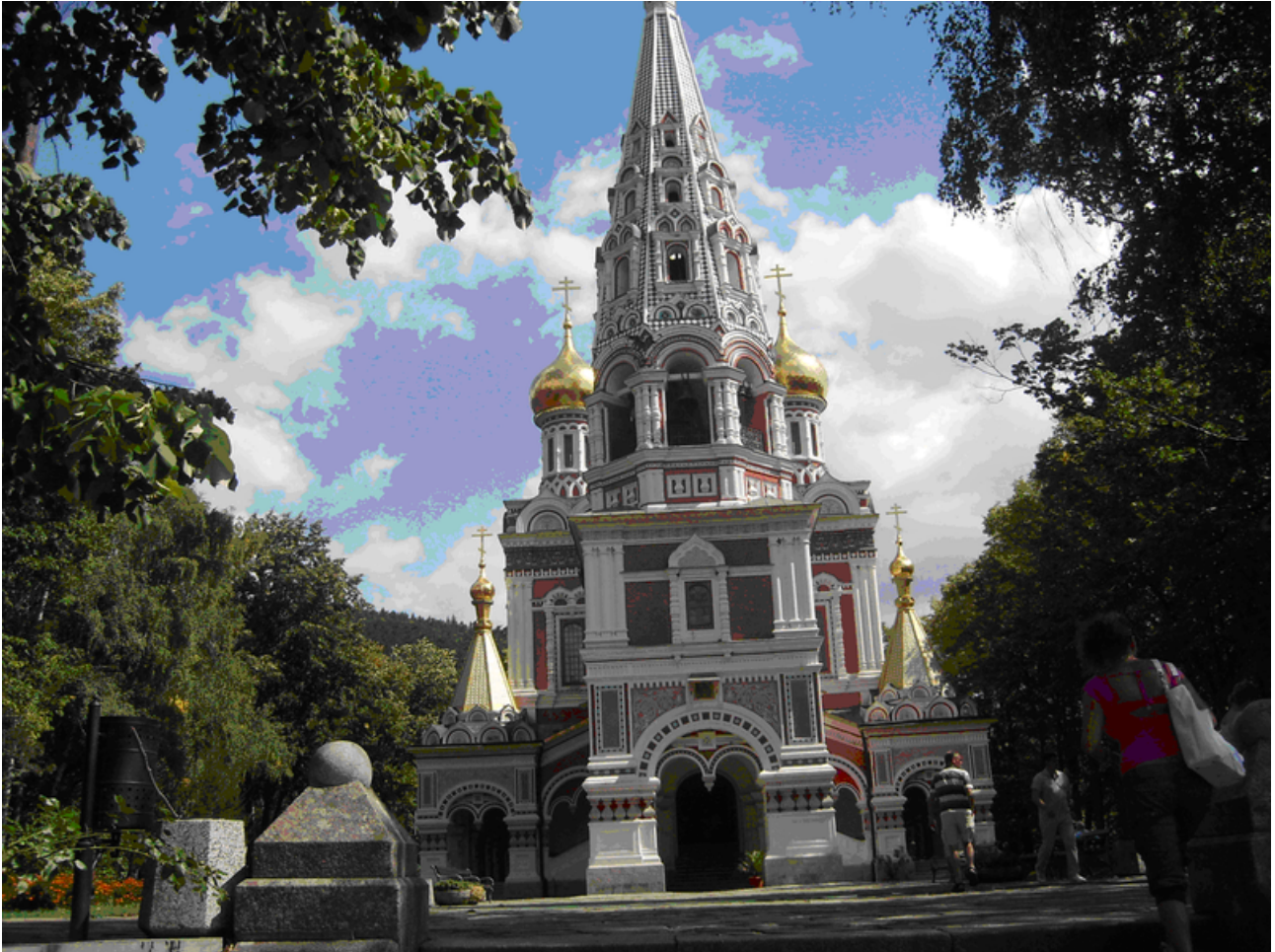
Ryska kyrkan i Shipka