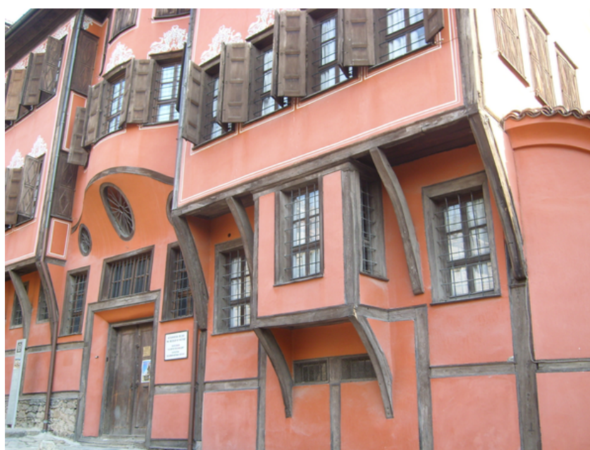
Köpmanhus i Plovdiv

Den första anhalten var Bulgariens näst största stad, Plovdiv, med anor från 4000 år f Kr. Den är en av Europas längst bebodda städer. Här besökte vi bl a den romerska teatern som byggdes åren 114-117 e Kr, ett gammalt köpmanshus, Balabanovs Hus från 1800-talet. Vi avslutade vandringen i gamla staden för att som kontrast gå genom den nya delen.