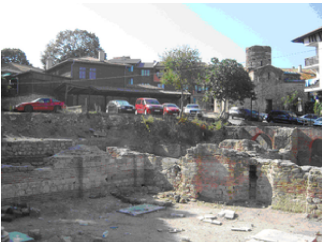
Romerskt bad i Nessebar