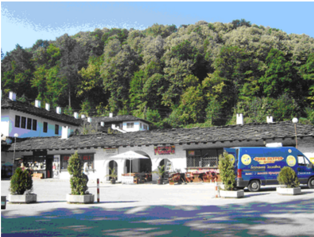
Klostret i Troyan

Här fördrev vi tiden med vila och avkoppling omväxlande med promenader, vattengymnastik och massage. Vi gjorde även utflykter till Pleven med sitt Panoramamuséum, ett gammalt kloster i staden Troyan och ett skolbesök hann vi också med..