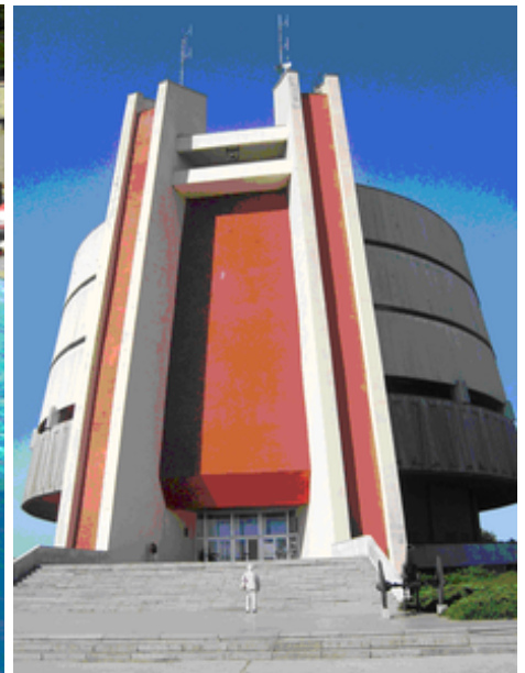
Panoramamuseum i Pleven

Dagens mål var den lilla bergsbyn Cheflika med sin mineralvattenkälla. Denna källa förser byn med varmvatten även den bassäng som tillhör det hotell vi bor på.