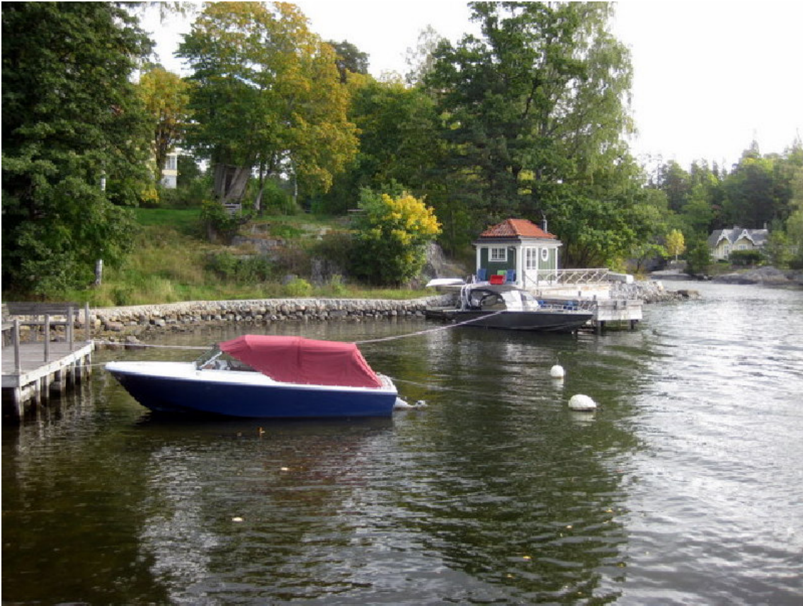
Knapens hål i klart väder