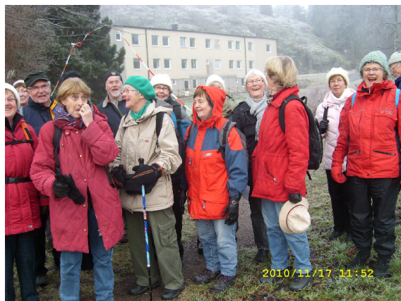
Gänget utanför Gammeludden

Årets vandringar avslutades vid Boo gård och utefter Stäkets stränder. Boo gård ligger vid Baggensfjärdens inlopp till Stäket. Redan 1282 omnämns gården i samband med ett gåvobrev från kung Magnus Ladulås. Under medeltiden tillhörde Boo Clara kloster i Uppsala stift men drogs vid reduktionen 1527 in till kronan.