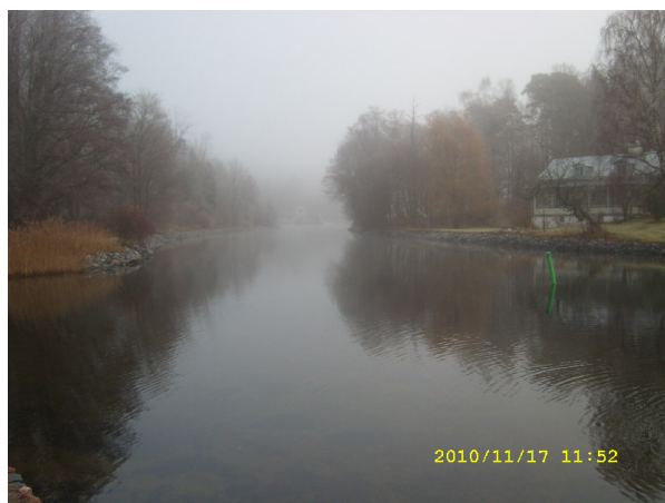
Knapens håll i dimma

Vi fortsatte förbi några vikingagravar och kom så ner till Stäket vid "Knapens håll" . Här låg en s.k. bomspärr fram till 1682. Utefter stranden uppfördes ett antal "Grosshandlarvillor" under senare delen av 1800-talet.