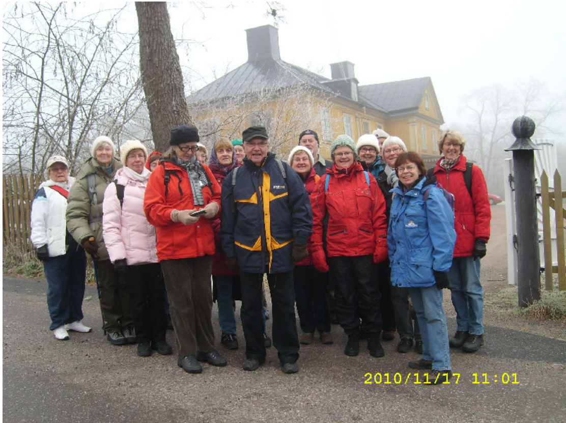
Åter vid Boo gård