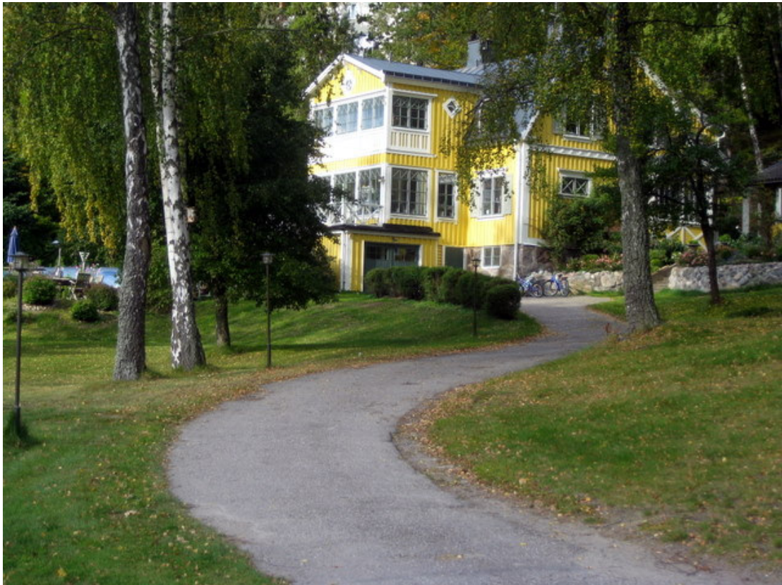
Grosshandlar Pettersson Villa