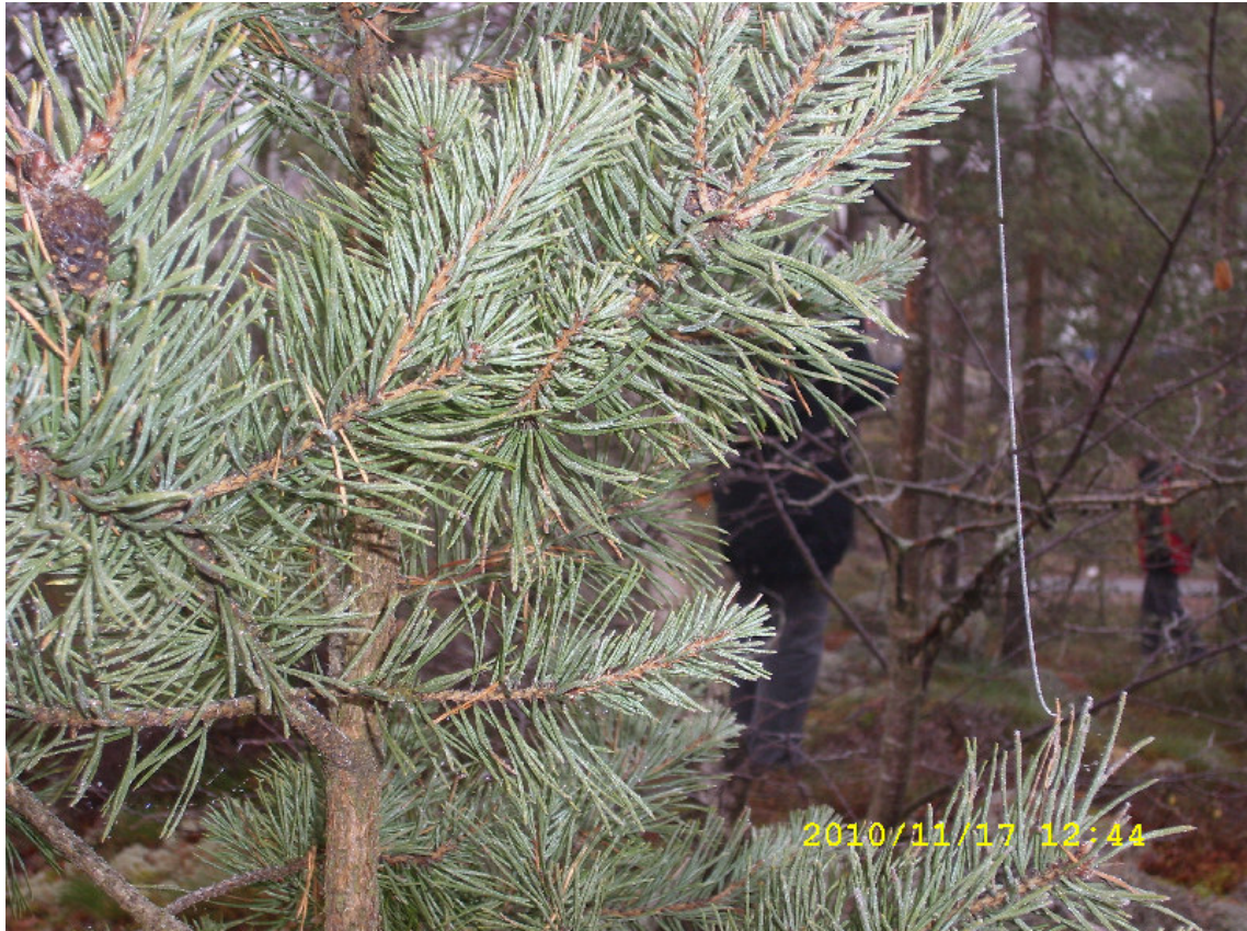
Jultallen är klädd