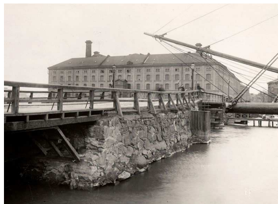
Eldkvarn och Kungsholmsbron ca 1860