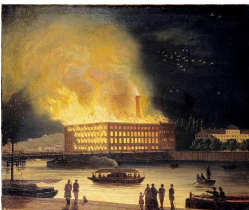
Eldkvarn brinner 31/10 1878 (Gustaf Carleman)

Fortsätt till vänster om huset och ut på Norr Mälmarstrand, passera Ragnar Östbergs plan och in genom grinden till Stadshusträdgården.